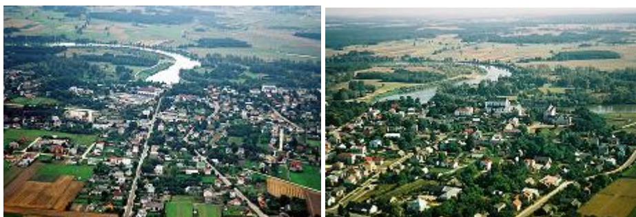
Drohiczyn z lotu ptaka