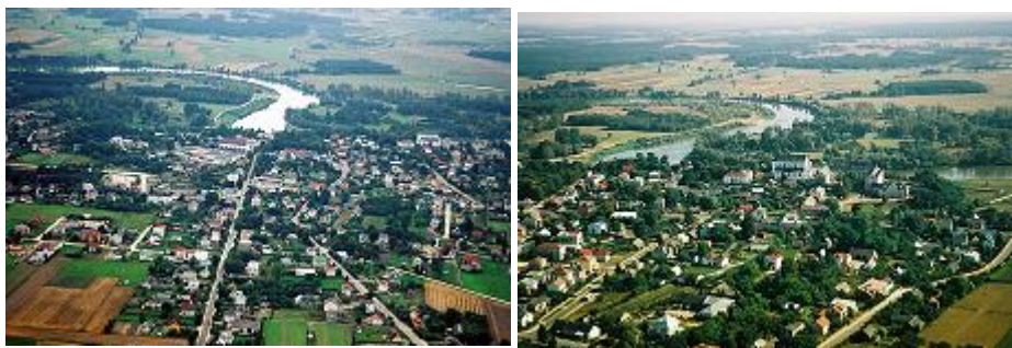
Drohiczyn z lotu ptaka