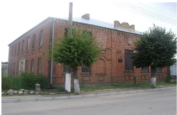
Synagoga z roku 1927r. w Milejczycach

W 1516 roku Milejczyce otrzymały prawa miejskie z rąk króla Zygmunta. Zakończenie działań I wojny światowej pozbawiły Milejczyc praw miejskich. Bogate tradycje wielonarodowościowe, dobre stosunki międzyludzkie oraz bogaty potencjał i walory przyrodnicze pozwalają optymistycznie patrzeć w przyszłość i rozwój naszej gminy.