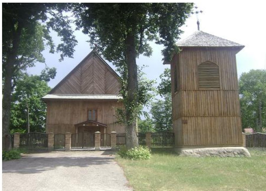
Kościół św. Stanisława w Milejczycach