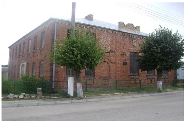
Synagoga z roku 1927r. w Milejczycach

W 1516 roku Milejczyce otrzymały prawa miejskie z rąk króla Zygmunta. Zakończenie działań I wojny światowej pozbawiły Milejczyc praw miejskich. Bogate tradycje wielonarodowościowe, dobre stosunki międzyludzkie oraz bogaty potencjał i walory przyrodnicze pozwalają optymistycznie patrzeć w przyszłość i rozwój naszej gminy.