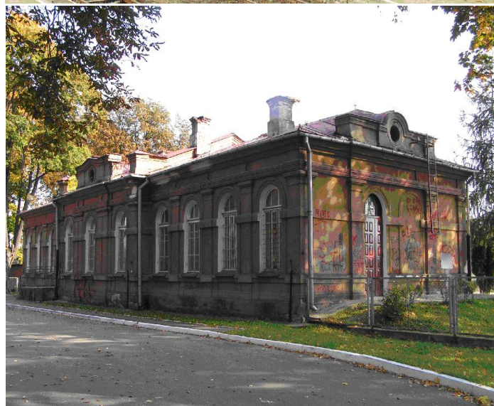
Nurzec Stacja, dworzec kolejowy