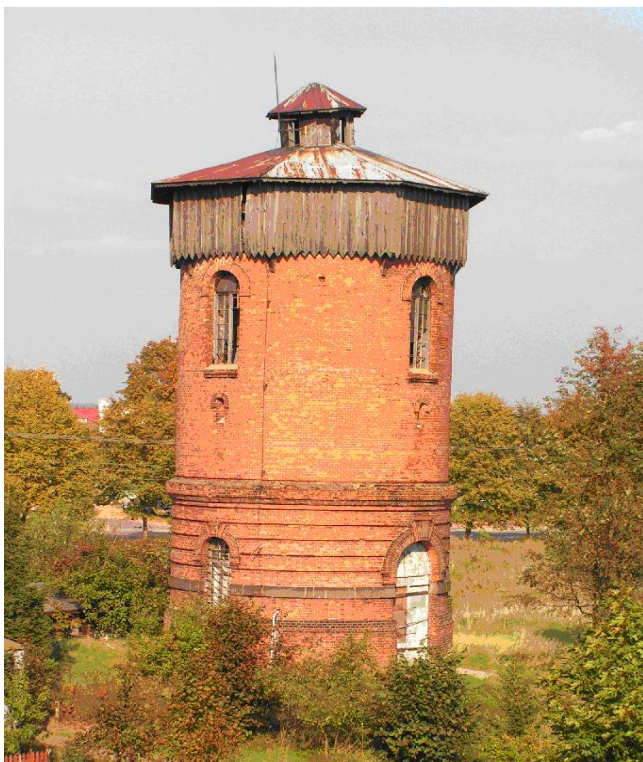
Nurzec Stacja, wieża ciśnień w zespole dworca kolejowego

Dworzec zbudowany około 1906 roku. Budynek murowany z cegły, otynkowany. Posadowiony na cokole z ciosów kamiennych. Jednokondygnacyjny na planie prostokąta z ryzalitami środkowymi w częściach wzdłużnych. Otwory okienne i drzwiowe zamknięte łukiem pełnym. Osie wydzielone pilastrami z gładkimi trzonami. Ściany obiega profilowany gzyms cokołowy, gzyms kordonowy znajdujący się nad łukami otworów i wydatny, uskokowy gzyms wieńczący. Pomiedzy oknami płaski gzyms dzielący pilastry i okna. Elewacje wzdłużne z trójosiowymi środkowymi ryzalitami. W ścianie południowej ryzalit z drzwi wejściowymi w skrajnych osiach a w osi środkowej blenda powtarzająca kształt okien. W ryzalicie północnym trzy okna, wejście poza ryzalitem w czwartej osi. Elewacja wschodnia z analogicznymi podziałami, dwuosiowa, z dwoma blendami powtarzającymi kształt okien. Elewacja zachodnia analogiczna, dwuosiowa z drzwiami wejściowymi i blendą. Ryzality zwieńczone w połąci dachu attyką mieszczącą w centrum okulus i zwieńczoną wydatnym gzymsem, połączona metalową balustradą z narożną częścią ściany ogniowej. Ściany szczytowe również zwieńczone attyką mieszczącą w centrum okulus i zwieńczoną wydatnym gzymsem. Budynek przykryty dachem czterospadowym z blachy ocynkowanej malowanej na czerwono. Na dachu dwa mury ogniowe wyznaczające część środkową budynku.