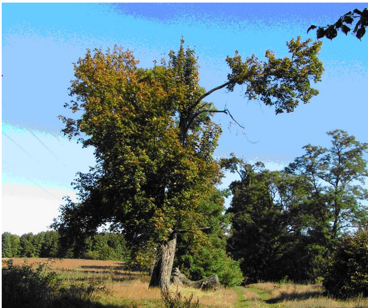
Nurczyk, pozostałości parku