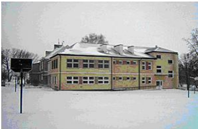
Szkoła Podstawowa i Gimnazjum w Korczewie

Korczew i okolice są regionem o ponad 600-letniej tradycji. Wspaniałe położenie geograficzne, piękne okolice, bogata fauna i flora, zabytki kultury stwarzają warunki, aby właśnie tu inwestować oraz nawiązywać kontakty gospodarcze i handlowe , a także by uczynić z naszego regionu bazę dla rozwoju turystyki i wypoczynku.