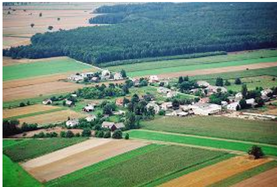
Zdjęcie z lotu ptaka

Gmina Korczew ma charakter typowo rolniczy. Przeważają tu średniej wielkości indywidualne gospodarstwa rolne. Na obszarze gminy prowadzą działalność głównie niewielkie podmioty gospodarcze m. in.: zlewnia mleka, piekarnia, młyn handlowo - usługowy, różne zakłady usługowe oraz drobne placówki handlowe.