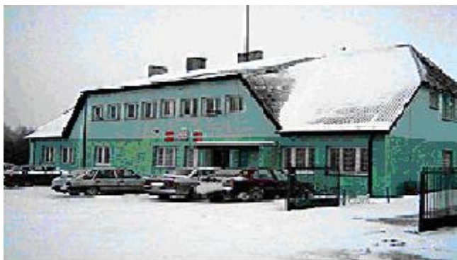
Urząd Gminy w Korczewie

Gmina jest w 90% zwodociągowana i w 60% ztelefonizowana. Na terenie gminy działają 6 gospodarstw agroturystycznych, zapewniające około 50 miejsc noclegowych wraz z wyżywieniem. Ponadto do dyspozycji gości jest wolno stojąca baszta pałacowa z kompletnym wyposażeniem, przystosowana do zakwaterowania czterech osób oraz salon myśliwski w Bartkowie Starym.