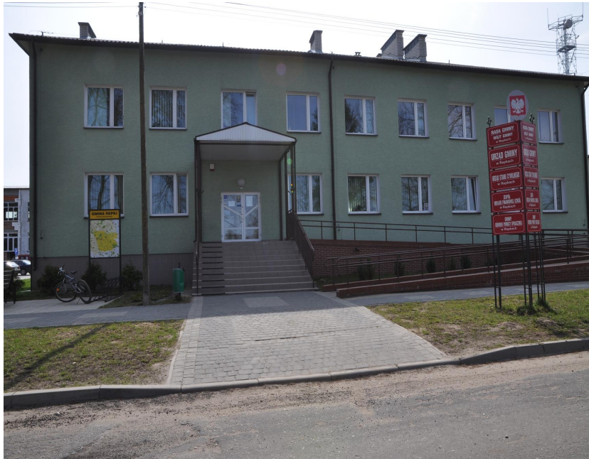
Urząd Gminy Repki

Liczba mieszkańców gminy na koniec roku 2008r. - 5 965 osób.