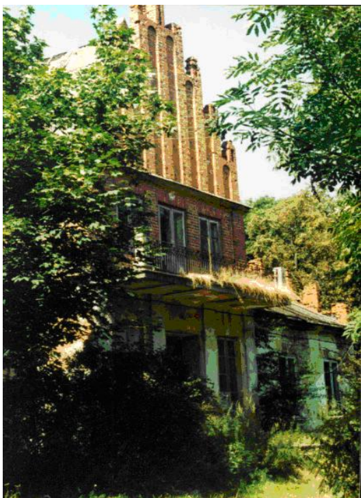
Zespół dworski w Chotyczach