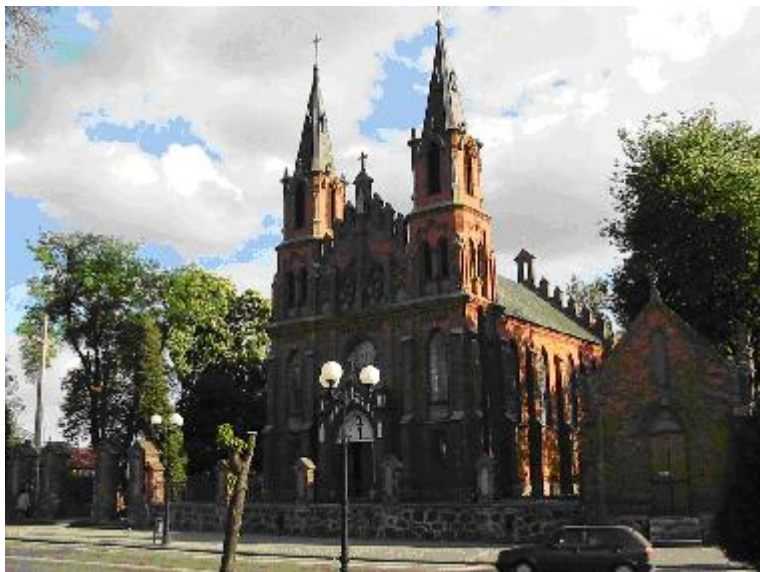
Zespół kościoła parafialnego p.w. św. Zygmunta w Łosicach

W sąsiedztwie zalewu znajduje się Park XX-lecia PRL, który powstał w miejscu żydowskiego cmentarza utworzonego na mocy przywileju wydanego przez króla Jana III Sobieskiego w 1690 r., zniszczonego przez hitlerowców w czasie II wojny światowej. 20 maja 2008 r. odbyła się uroczystość reedukacji cmentarza. Zbiór macew z łosickiego cmentarza jest najliczniejszą kolekcją żydowskiej sztuki kamieniarskiej na południowym Podlasiu. Najstarsze zachowane nagrobki pochodzą z pierwszej połowy XIX wieku.