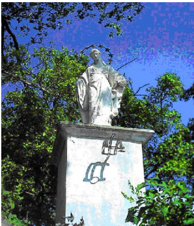
Kapliczka przydrożna w Toporowie

Teren Miasta i Gminy jest bardzo zróżnicowany pod względem wartości przyrodniczych, które można ocenić m.in. na podstawie występowania i rozmieszczenia różnych gatunków ptaków. Łącznie w ostatnich latach stwierdzono