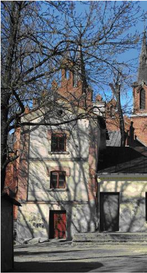
Klasztor księży Komunistów w Łosicach