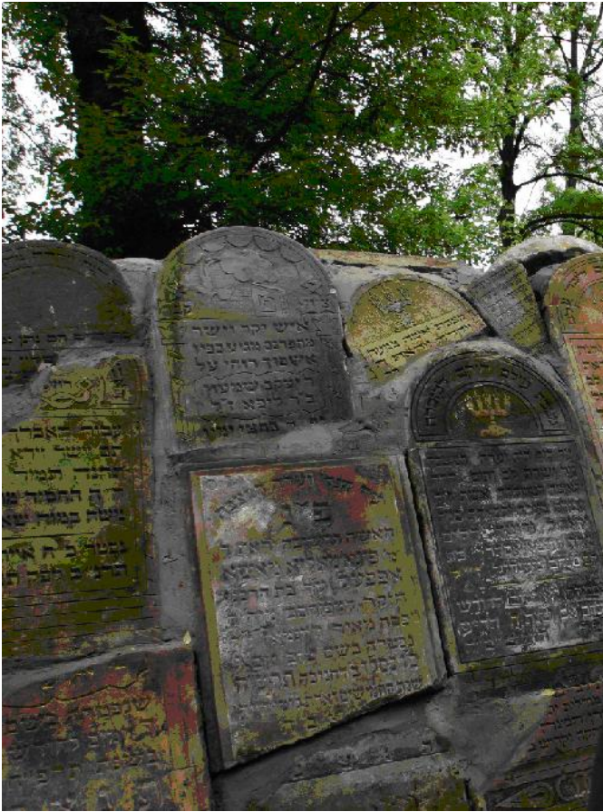
Macewy na Cmentarzu żydowskim w Łosicach